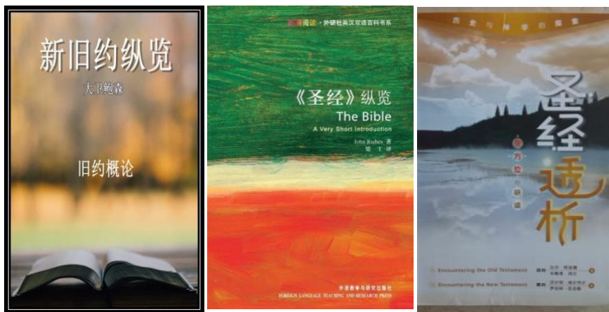
(图：圣经概览（概论、纵览）)