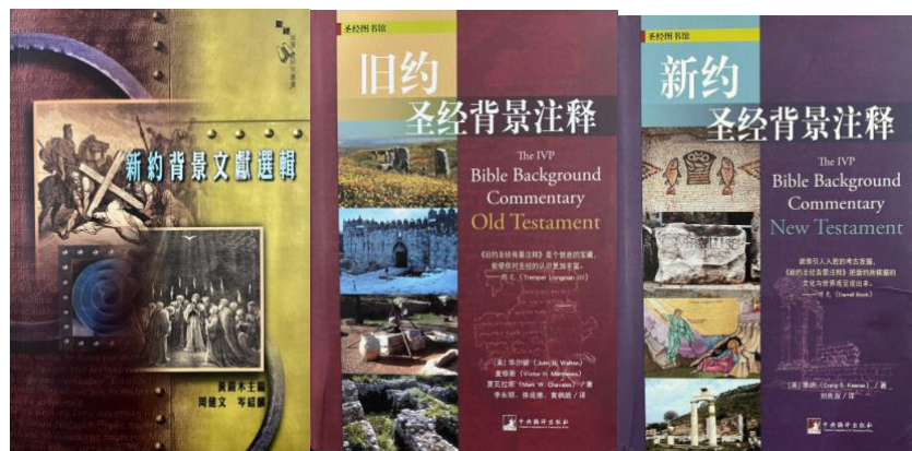
(图：新旧约圣经背景注释)